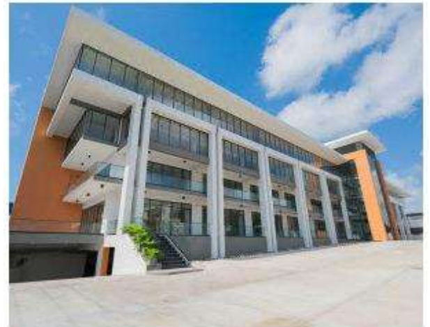
Edificio Galería 44

Dos edificaciones y centro de inspección especializado de vehículos que cuentan con 49 parqueos localizado Av. Lope de Vega Esq. Fantino Falco, Ens. Naco, Distrito Nacional. Su nivel de ocupación es de 100%