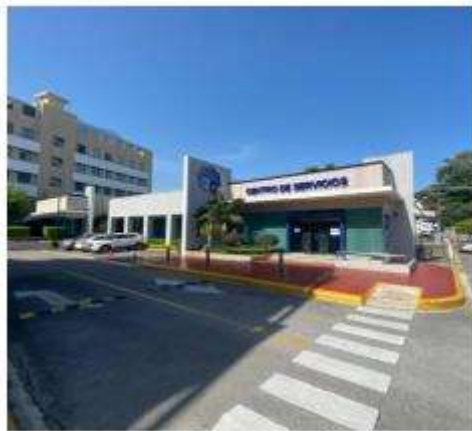
Centro de Servicios Lope de Vega

Dos edificaciones y centro de inspección especializado de vehículos que cuentan con 49 parqueos localizado Av. Lope de Vega Esq. Fantino Falco, Ens. Naco, Distrito Nacional. Su nivel de ocupación es de 100%