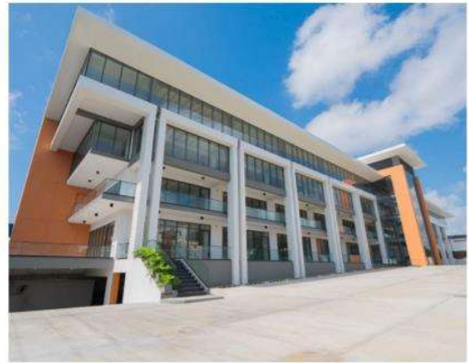
Edificio Galería 44

Dos edificaciones y centro de inspección especializado de vehículos que cuentan con 49 parqueos localizado Av. Lope de Vega Esq. Fantino Falco, Ens. Naco, Distrito Nacional. Su nivel de ocupación es de 100%