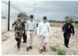
Ministro recorrió la frontera. F.E.